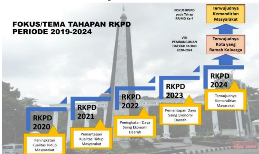
Gambar 2.2 Fokus/Tema Tahapan RKPD Periode 2019-2024

Sumber : Hasil Olahan Bappeda Kota Bogor, 2019