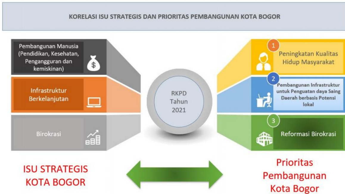
Gambar 2.4 Permasalahan, Isu Strategis, dan Prioritas Pembangunan Kota Bogor pada Tahun 2021