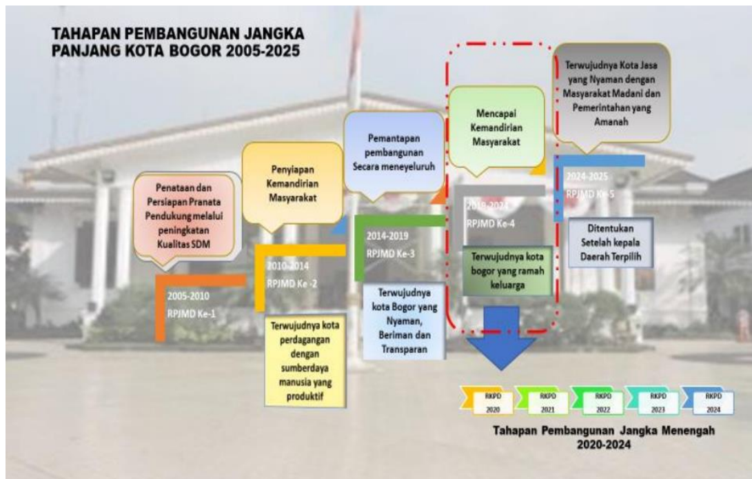
Gambar 2.1 Tahapan Pembangunan Jangka Panjang Kota Bogor Tahun 2005 – 2025